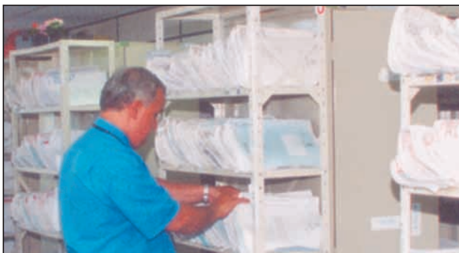
Com prateleiras cheias de processos, TJ permite extinção em massa

O Ato 18/09 afirma que "os processos distribuídos até 31 de dezembro de 2005 que se encontram no arquivamento provisório sem julgamento poderão ser desarquivados virtualmente e o magis-