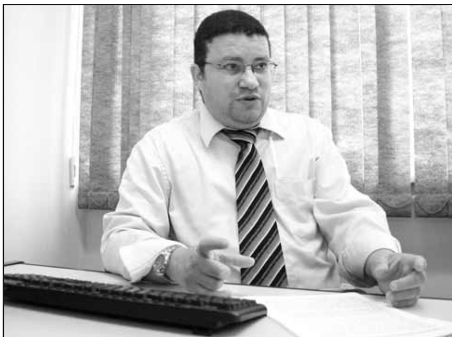
Marcos lembra que a responsabilidade civil é do patrão daquele que comete o ilícito

— A questão que apresenta maior complexidade em relação ao tema diz respeito ao alcance da eficácia preclusiva das decisões condenatórias ou absolutórias do juízo penal ao responsável civil , não integrante da relação processual penal. Tópico este, tratado pela atilada doutrina como a extensão da subordinação temática existente entre a instância cível e criminal. Parte da doutrina sustenta a impossibilidade de extensão de efeitos erga omnes da decisão criminal condenatória para atingir a pessoa do responsável civil , ao fundamento de que os limites subjetivos da coisa julgada que, via de regra, lança efeitos apenas em face de quem tenha sido parte nos processos dos